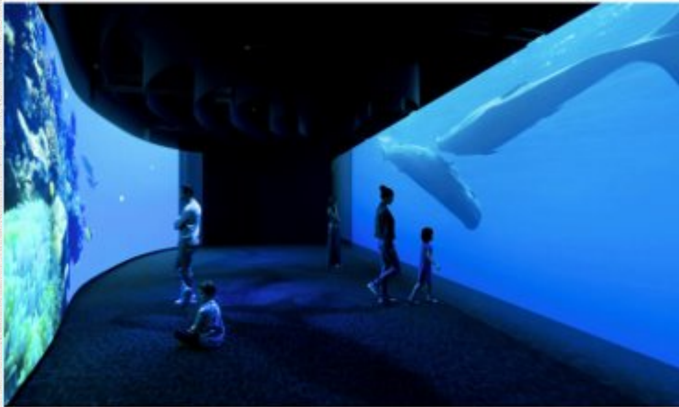
La nouvelle exposition temporaire du Muséum national d'histoire naturelle de Paris démarre ce samedi. (Projectiles/Mardis/Sensory Ody)

« Jamais on n'avait vu la nature d'aussi près, aussi nette, aussi vraie, et jamais on n'avait entendu une mante grignoter une larve. Faut-il vraiment sortir de cette salle un jour ? »