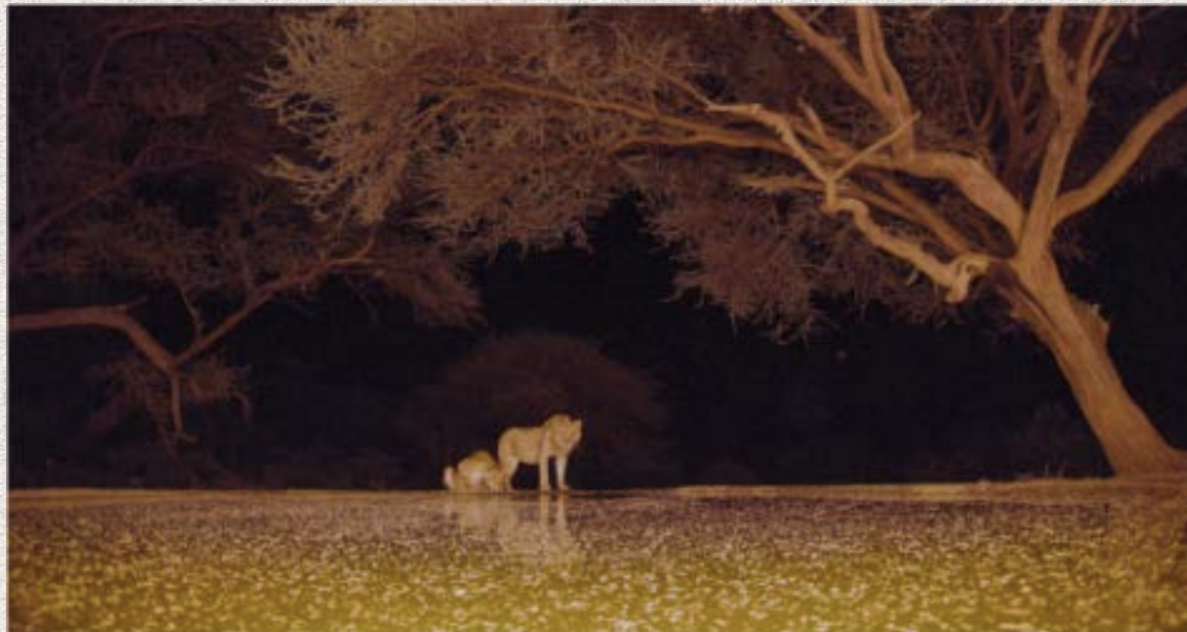
Une lionne aux abords d'un étang de la savane, au sud du Kenya, à l'exposition « L'Odyssée sensorielle », Muséum d'histoire naturelle, à Paris.