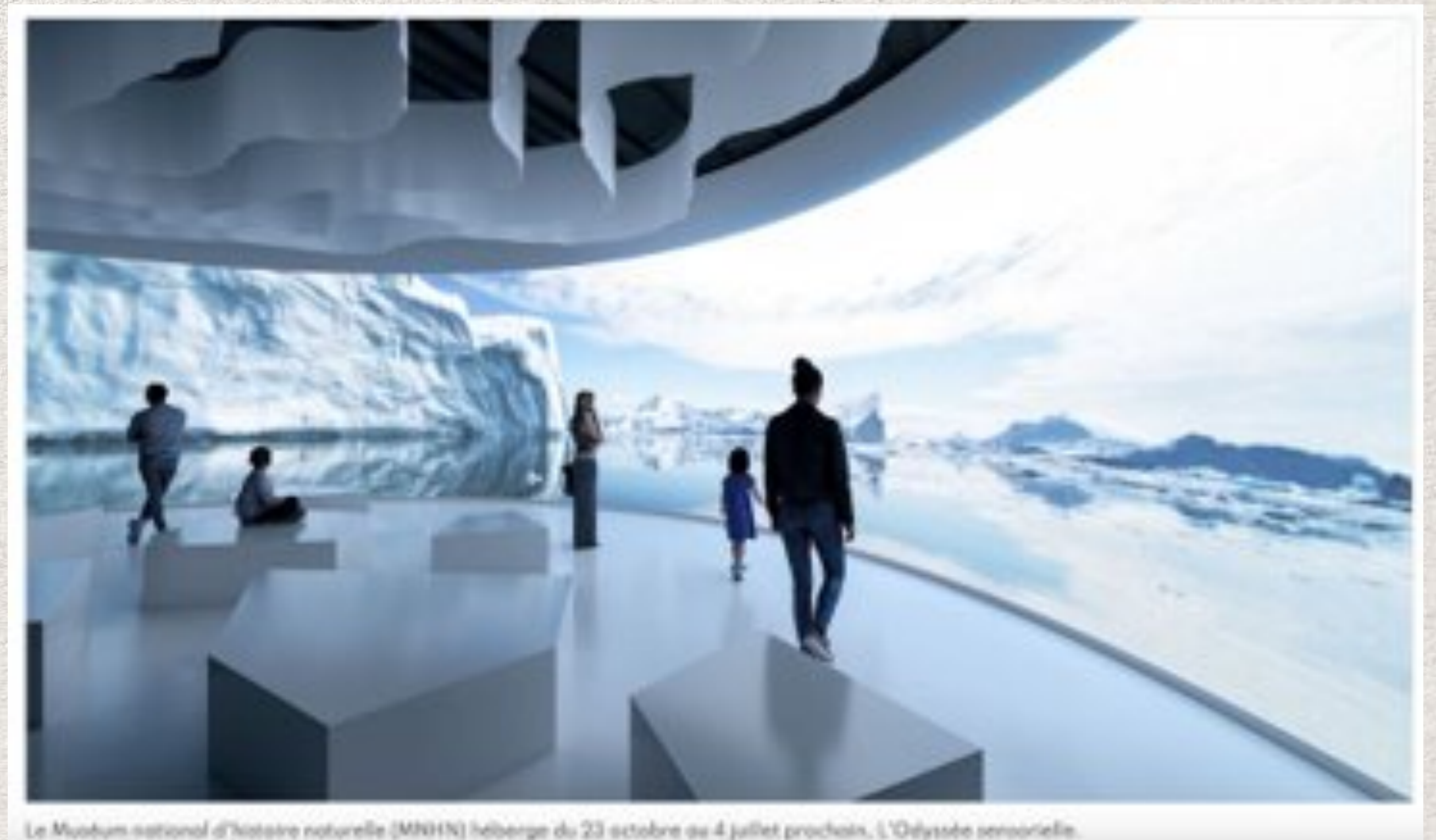
Le Muséum national d'histoire naturelle (MNHN) héberge du 23 octobre au 4 juillet prochain, L'Odyssée sensorielle.

"...Le fait d'utiliser des odeurs lui donne une réalité plus grande et permet de générer des émotions."