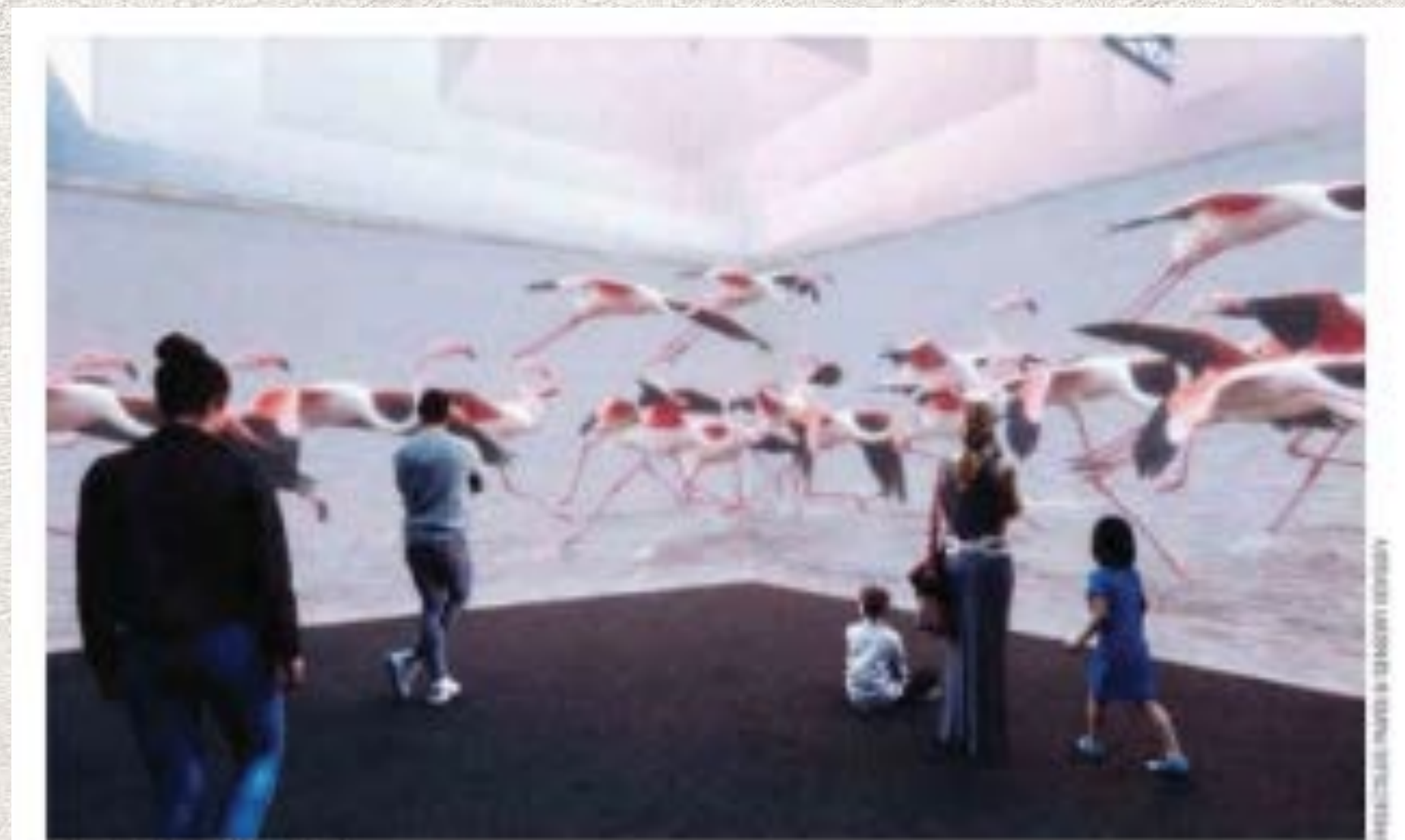
L'exposition « l'Odysée sensorielle » plonge le visiteur dans une dizaine d'environnements différents, des tropiques aux pôles.

“Ce parcours est un voyage hyperréaliste qui nous plonge dans une dizaine de paysages, des tropiques aux pôles. L’immersion est totale, multi-sensorielle...”