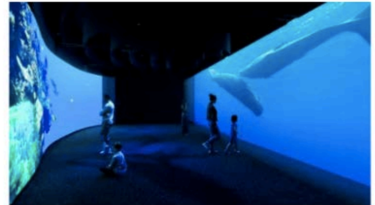
Au Muséum national d'histoire naturelle de Paris, l'exposition « L'Océan, du récif corallien à la pleine mer ». PROJECTILES/MARDIS/SENSORY ODYSSEY

Frappés par la crise sanitaire et la désaffection du public, les lieux culturels cherchent à rebondir pour attirer de nouveaux visiteurs. Les musées investissent notamment de plus en plus dans des scénographies inédites, grâce aux technologies numériques. Le Muséum national d'histoire naturelle de Paris propose ainsi une « Odyssée sensorielle » à travers la planète, quand le Musée d'art moderne de Fontevraud-l'Abbaye (Maine-et-Loire) invente un dialogue entre statues.